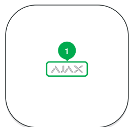
1 - Logo avec éclairage lumineux